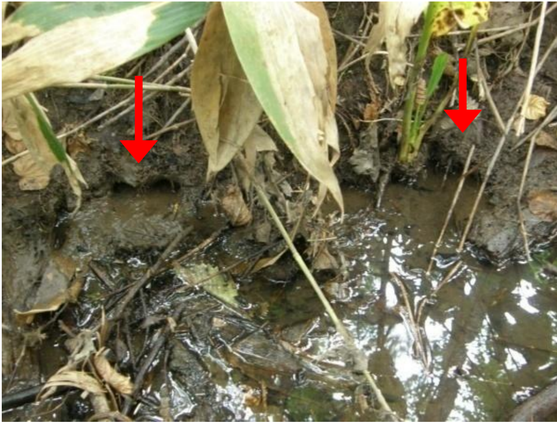
ニホンザリガニの一般的な巣穴。矢印で示した水際に入口がある。