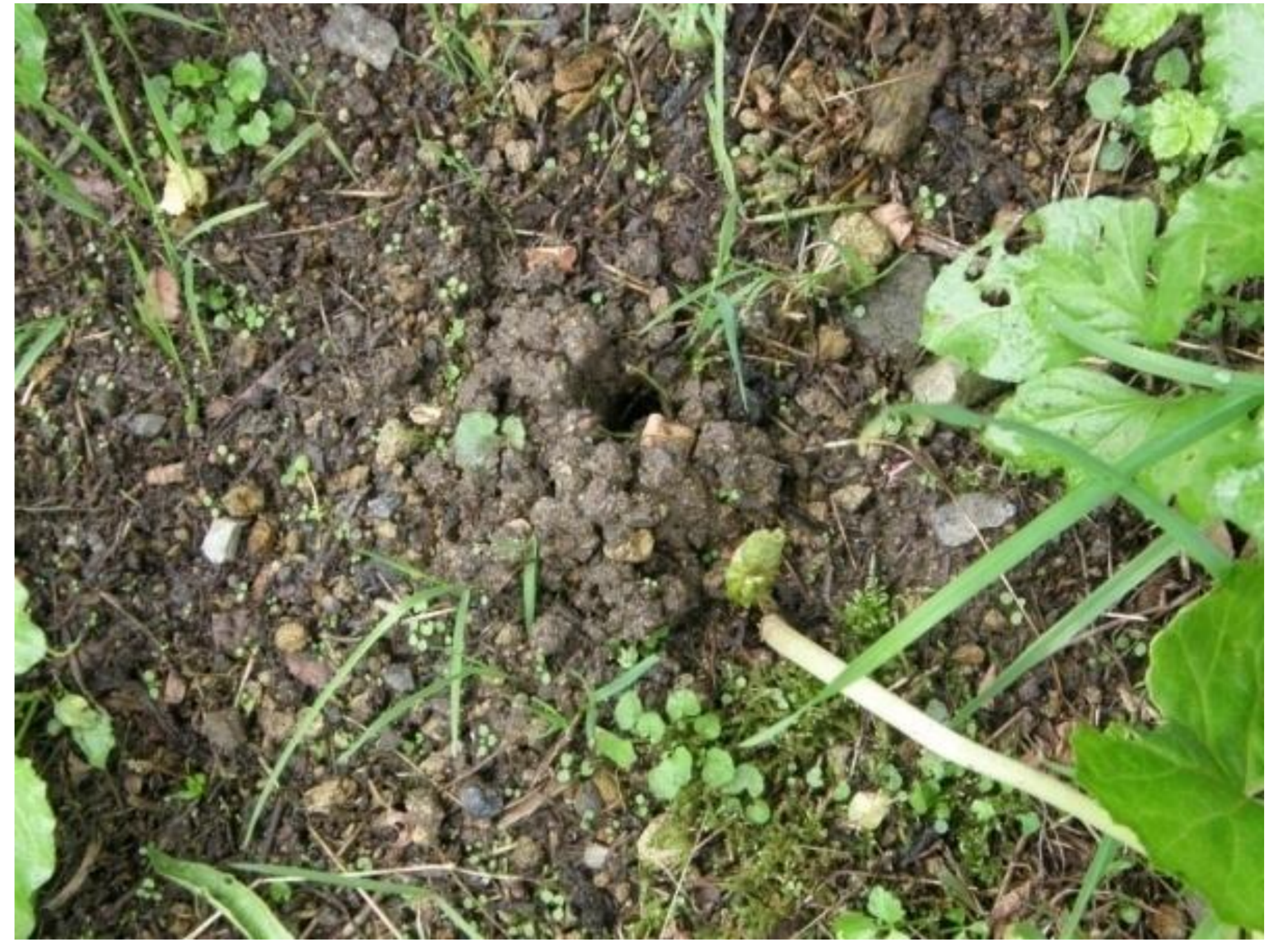
水際から離れた場所に入がある巣穴では、積み上げられた泥が乾燥している。