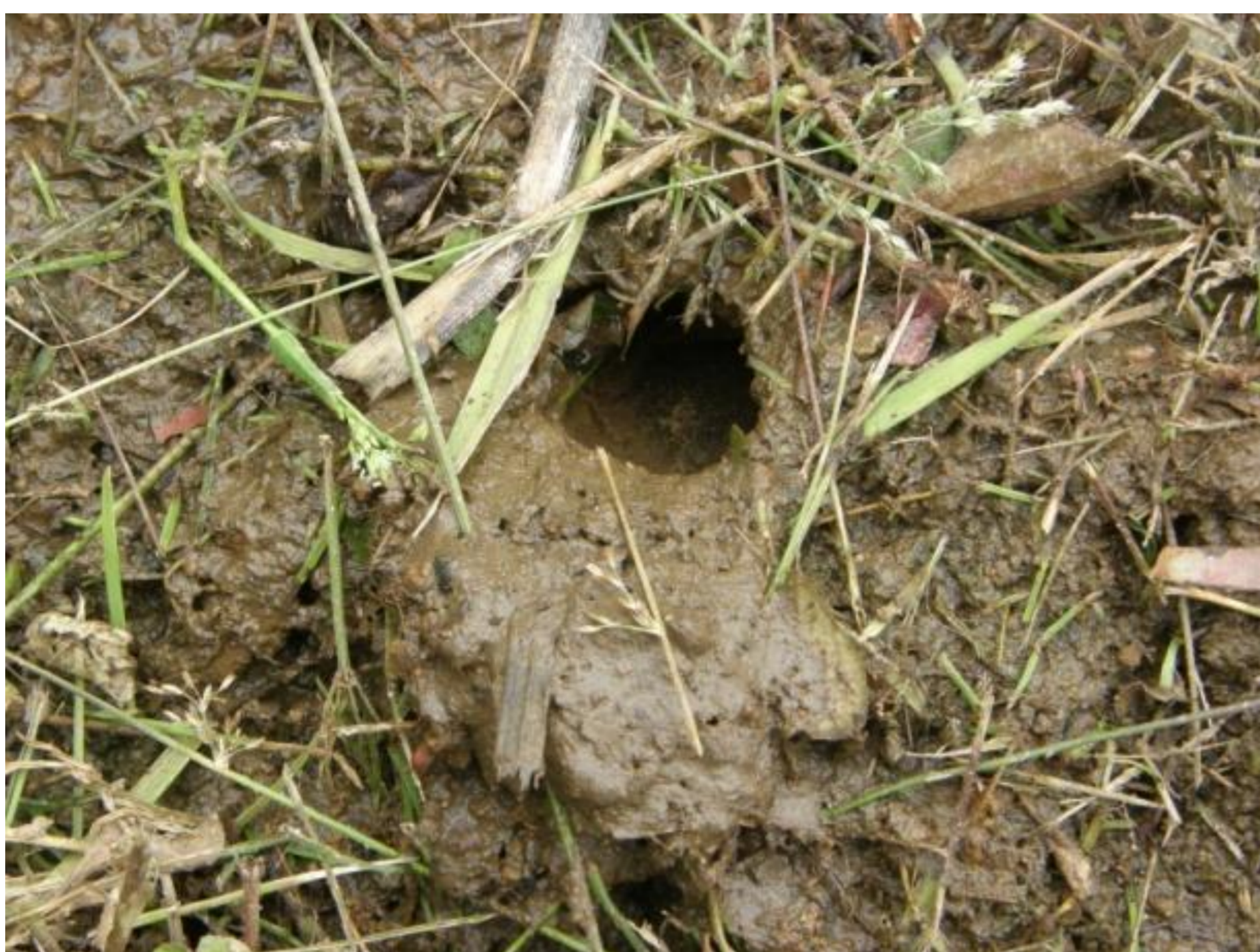
斜面に掘られた巣穴。入口にたくさんの泥団子が積みあげられている。