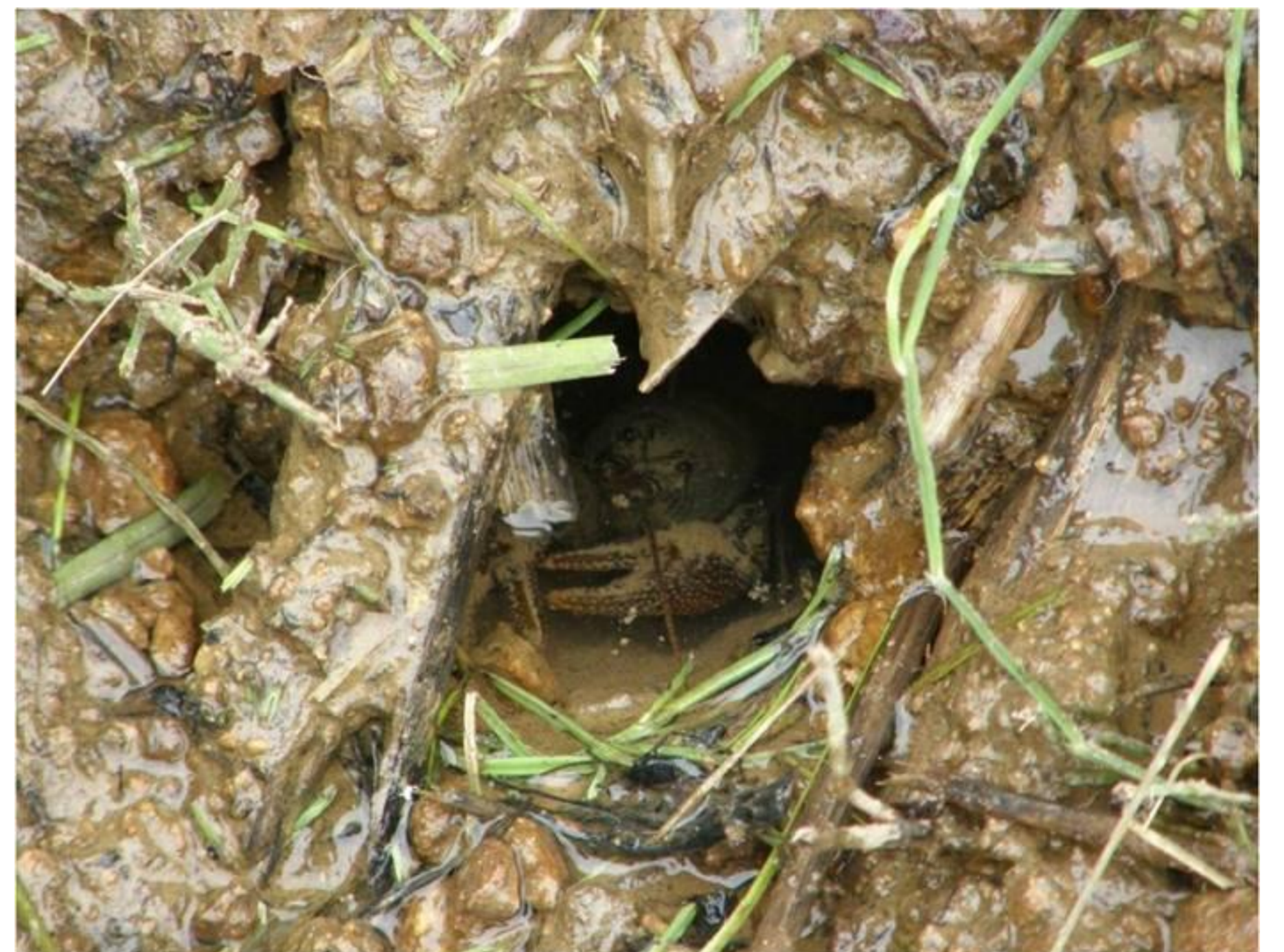
内部から小石を運び出して巣穴を補修しているニホンザリガニ。