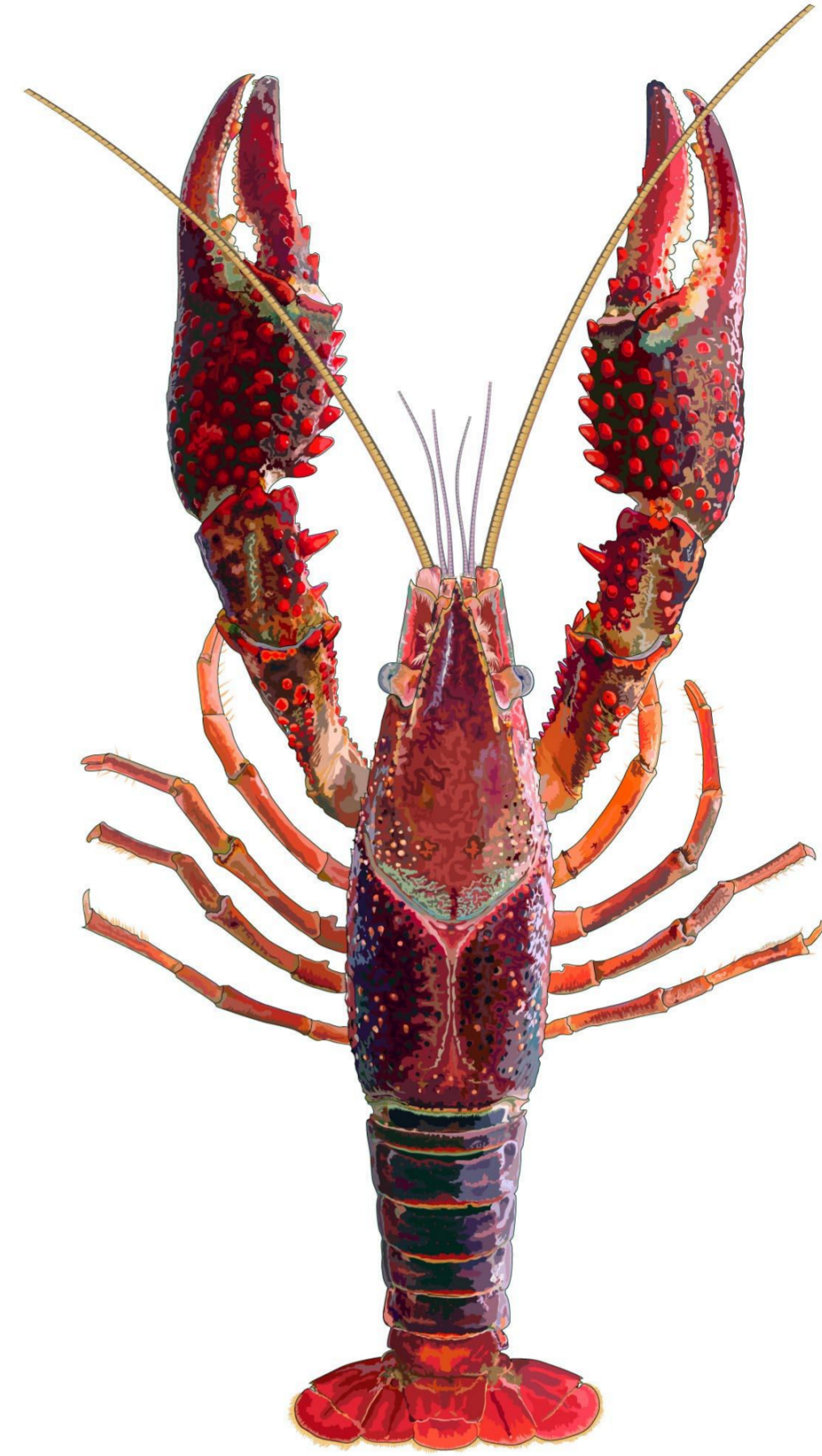
アメリカザリガニ (外来種)