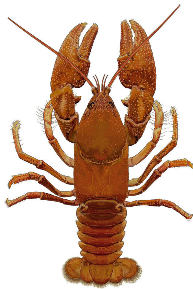
ニホンザリガニ (日本固有種)