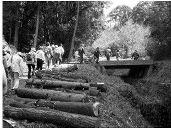
4月13日 野洲川ごみ拾いウォーク