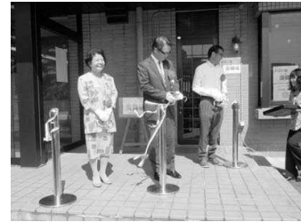
5月23日 市民サロン 「すまいる」オープニング