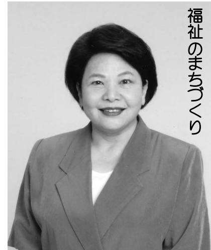
福祉のまちづくり