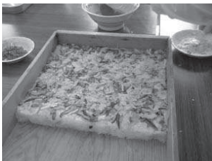
きらめき湖南押し寿司 大会「おいしかった！ 伝統の味」