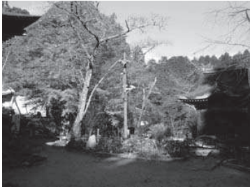
昨秋の湖南三山には、26500人の 観光客が訪れました