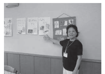
ケアハウスの絵てがみボランティア 「下手がいい・下手でいい」あ なたの感性で描いてみませんか？