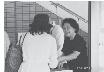
議会 東日本大震 災復興支援コンサ ート