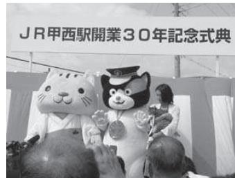
和歌山からタマ駅長キャラも応援 参加の甲西駅開業30周年。駅舎を 早くバリアフリーに！