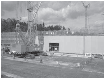
甲賀病院の新築 工事が、25年 1月の完成に向 けてすすんでい ます