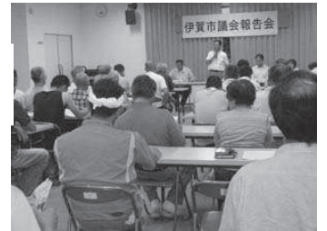
伊賀市議会 議会報告会