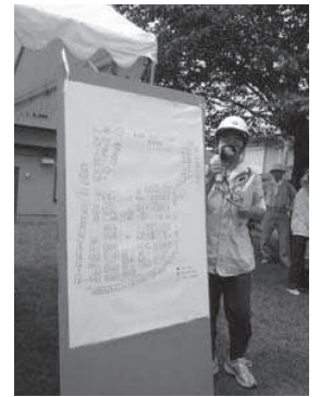
北山台防災訓練 公園へ避 難してきたら、住居地図に ○をつけます