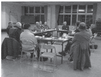
市民生涯学習講座「地域史に関わる 人たちの交流会」 身近な地域の歴 史を掘り起こし次代へつないでい かれる人たちのお話に感動しまし た