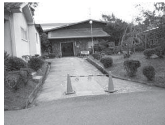
「かふかの家」見学研修 運営 の厳しい中で、家庭に居場所の ない子どもたちの生活を支えて 頂いています