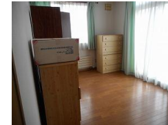
離れ洋室6帖洋間(3部屋)