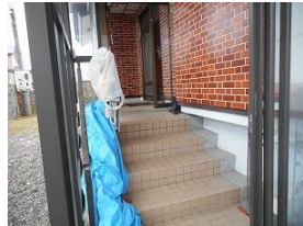
玄関フード(昇降機付)