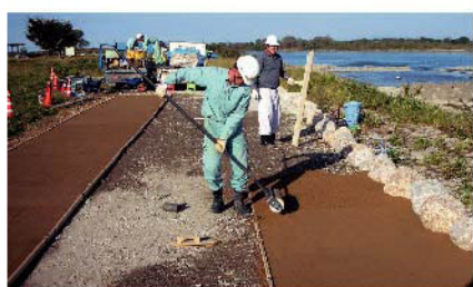
④コテ・ローラー等で押さえる