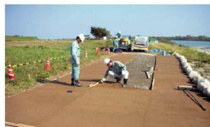
③均一に敷きならす。