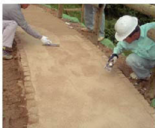
②均一に敷きならし、コテで表面を押さえ平らにする。