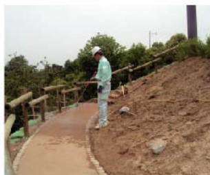
③表面が湿る程度に1次散水、時間を置いてから2次散水を行う。