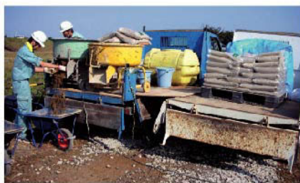
②モルタルミキサー攪拌