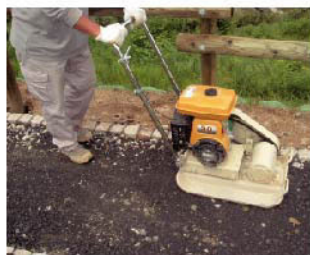
①路盤が動かないようよく締め固め、路盤に水を十分に撒く。