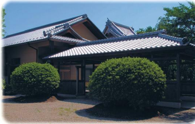
心王殿（多目的ホール）

壁面には、多くの書画が掲げられていて、心が癒されます。ホールはどなたでもご利用になれます。