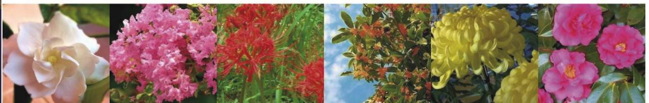
7月 クチナシ 8月 サルスベリ 9月 彼岸花 10 キンモクセイ 11月 菊 11月 サザンカ