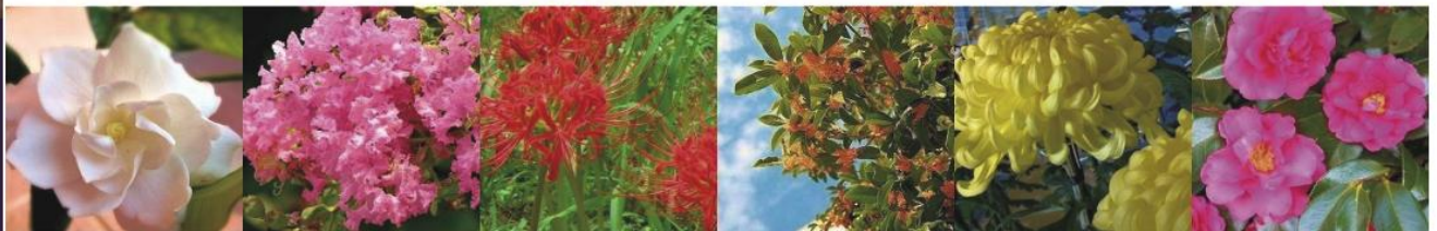
7月 クチナシ 8月 サルスベリ 9月 彼岸花 10 キンモクセイ 11月 菊 11月 サザンカ