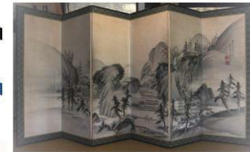
市指定重要文化財 金井烏州画屏風