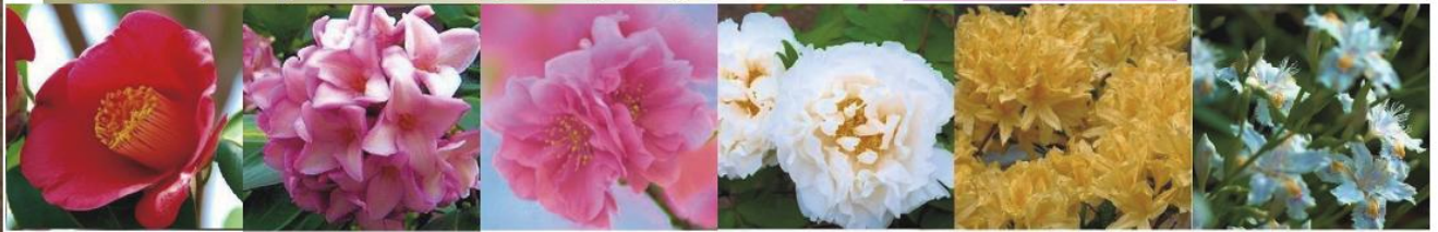
1月 椿 2月 ジンチョウゲ 3月 だけれ桃・桜 4月 牡丹・つつじ 5月 やまぶき 6月 シヤガ