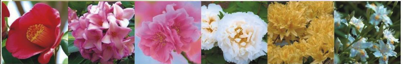
1月 椿 2月 ジンチョウゲ 3月 だけれ桃・桜 4月 牡丹・つつじ 5月 やまぶき 6月 シヤガ