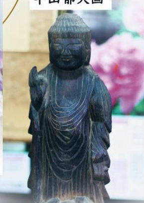
市指定重要文化財 円空仏