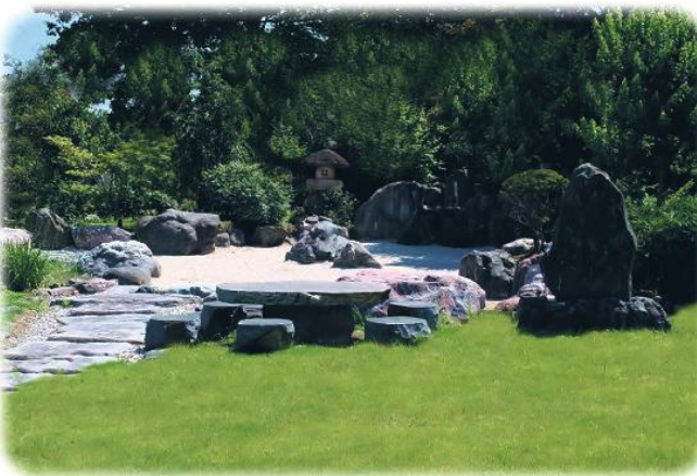
枯山水庭園 洗心苑