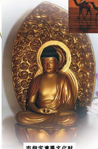
市指定重要文化財 阿弥陀如来像