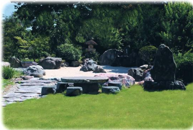
枯山水庭園 洗心苑